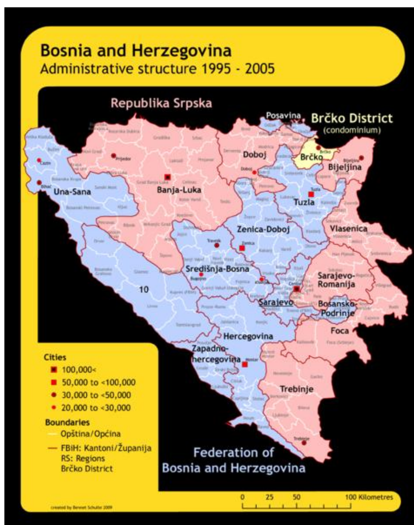
Rysunek 2 Podział administracyjny BiH

Jak zostało wcześniej wspomniane Bośnia i Hercegowina składa się z dwóch podmiotów- Federacji Bośni i Hercegowiny i Republiki Serbskiej. Status specjalny uzyskał dystrykt Brčko 5 . Federacja Bośni i Hercegowiny dzieli się na 10 kantonów, które z kolei dzielą się na 74 gminy, natomiast Republika Serbska podzielona jest na 7 regionów, dzielących się na 63 gminy 6 . Do kompetencji władz podmiotów składowych federacji należy kontrola nad siłami policyjnymi, polityką inwestycyjną i prywatycją, edukacją, urzędami statystycznymi, standaryzacją produktów, urzędami miar i wag oraz ochroną własności intelektualnej, współdecydują o świętach i symbolice obowiązującej na ich terytoriach.