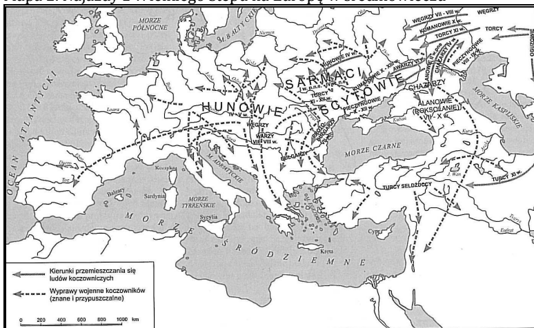
Mapa 2. Najazdy z Wielkiego Stepu na Europę w średniowieczu

Źródło: A. Michałek, Wyprawy krzyżowe: Armie ludów tureckich , Warszawa 2001, s. 9.