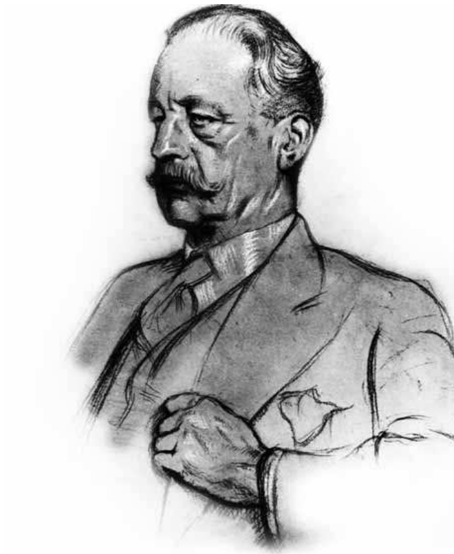
SIR HALFORD JOHN MACKINDER (1861-1947)